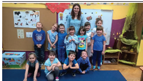
Przedszkolaki były ubrane na niebiesko.