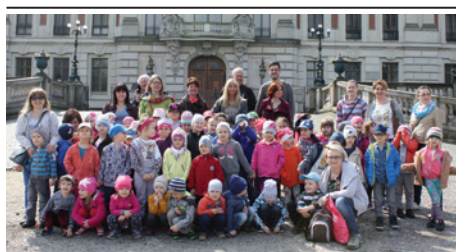
Pamiątkowe zdjęcie w Pszczynie.

Parafia Ewangelicka w Cieszynie współpracuje z parafią ze Schwabach na wielu płaszczyznach. 12 kwietnia rozpoczęła się współpraca między naszym przedszkolem a trzema