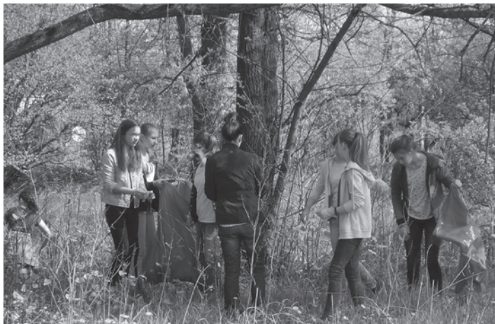
22 kwietnia przypadł kolejny Dzień Ziemi.

Wydawać by się mogło, że od 1 lipca 2013 r., czyli dnia wprowadzenia nowego systemu gospodarowania odpadami komunalnymi, w Cieszynie problem dzikich wysypisk powinien raz na zawsze zniknąć. Niestety, w wielu zakątkach Cieszyna – w lasach, w korytach rzek i potoków, pod przysłowiowym „krzakiem” – wciąż można natrafić na wyrzucone worki pełne śmieci, opony samochodowe, stare telewizory, meble czy lodówki. Dlaczego tak jest? Przecież zarówno mieszkańcy domów jednorodzinnych, bloków, kamienic oraz właściciele przedsiębiorstw – zarówno tych dużych, jak i małych, objęci zostali nowym systemem gospodarowania odpadami komunalnymi i w zamian za wnoszoną do budżetu miasta obowiązkową opłatę, mogą pozbywać się odpadów komunalnych, wystawiając je w kubkach przed nieruchomością, jak i samodzielnie dostarczając do Punktu Selektywnej Zbiórki Odpadów Komunalnych przy ul. Motokrosowej. Pozostaje mieć nadzieję, że dzikie wysypiska to nie kwestia... przyzwyczajenia i źle rozumianej tradycji! Faktem jest, że wyrzucone byle gdzie śmieci niszczą przyrodę i szpecą nasze miasto!