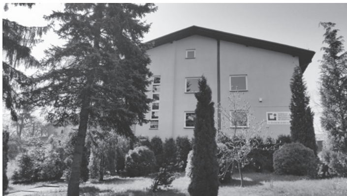
Siedziba Górniczej Spółdzielni Mieszkaniowej przy ul. Bielskiej.

Górnicza Spółdzielnia Mieszkaniowa w Cieszynie została powołana do życia przez Zebranie 14 Członków Założycieli w dniu 7 stycznia 1986 r., w celu zabezpieczenia potrzeb mieszkaniowych pracowników Kopalni Węgla Kamiennego Morcinek w Kaczycach. Rejestracja w Sądzie Rejonowym w Bielsku-Białej (VI Wydział Gospodarczy) miała miejsce w dniu 22 kwietnia 1986 r. Obecnie spółdzielnia zarejestrowana jest w Krajowym Rejestrze Sądowym pod nr 0000132579. Zrzeszona jest w Regionalnym Związku Rewizyjnym Spółdzielczości Mieszkaniowej w Katowicach.