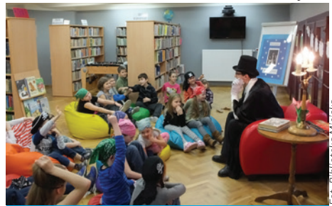
Zabawa w noc była przednia.