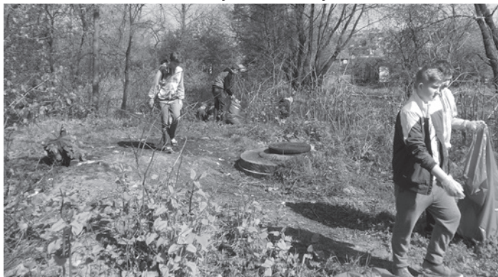
W czasie akcji worki szybko zapełniały się śmieciami.