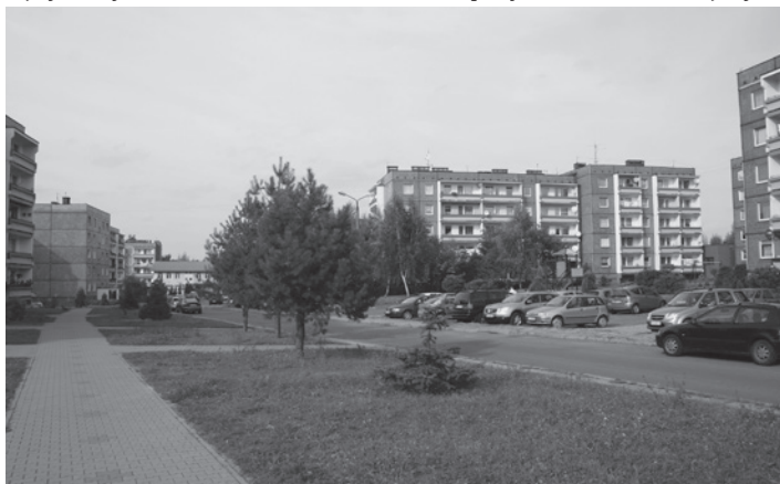
Do Górniczej Spółdzielni Mieszkaniowej należy m.in. osiedle w Pogwizdowie.

Jubileusz jest również okazją do podsumowań oraz staje się kolejnym wyzwaniem do szukania coraz lepszych, nowocześniejszych