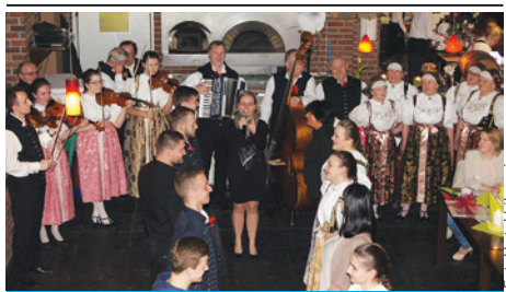
ZPiT Ziemi Cieszyńskiej i goście imprezy.