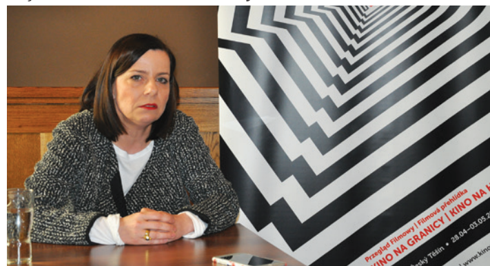
Agata Kulesza świeciła jasnym blaskiem w Cieszynie.

Mimo to, bardzo cenię tę rolę, choć samego filmu nie mogę oglądać. Generalnie jestem jednak zżyta ze wszystkimi moimi rolami. Poświęcam się im, głęboko w nie wchodząc. Do każdej roli starannie się przygotowuję, dużo czytam, dowiaduję się. I często, gdy wchodzę w okropieństwo wojny, przemoc czy agresję, jest mi zwyczajnie smutno. A swoje bohaterki nazywam silnymi ofiarami. Do tego uważam, że role, które są mi proponowane, wymagają pewnego ekshibicjonizmu emocjonalnego. Nie przepadam natomiast za rozbieraniem się, bo zwyczajnie się wstydzę. Uważam też, że nagość w filmie dawno przestała działać, więc pokazuję wyłącznie intymny świat moich emocji – mówiła Kulesza, którą można teraz oglądać w filmie Moje córki krowy . – To zupełnie inny obraz. Jest w nim śmierć, ale tym razem to nie ja umieram i bardzo mnie to cieszy – żartowała Kulesza.