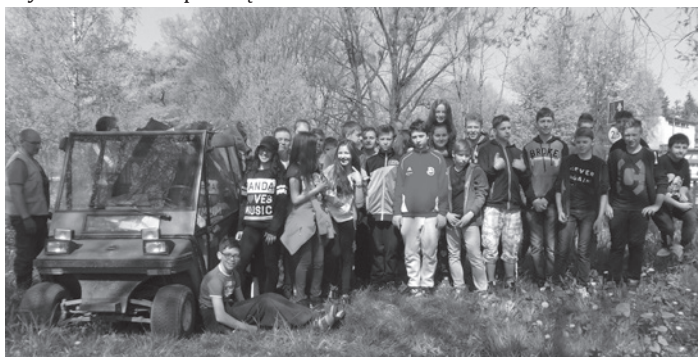
Na szczęście młodzież chętnie włącza się w proekologiczne akcje.

Wszystkim uczniom i ich opiekunom, którzy od lat własnoręcznie sprzątają nasze miasto, należą się od wszystkich mieszkańców Cieszyna serdeczne podziękowania!